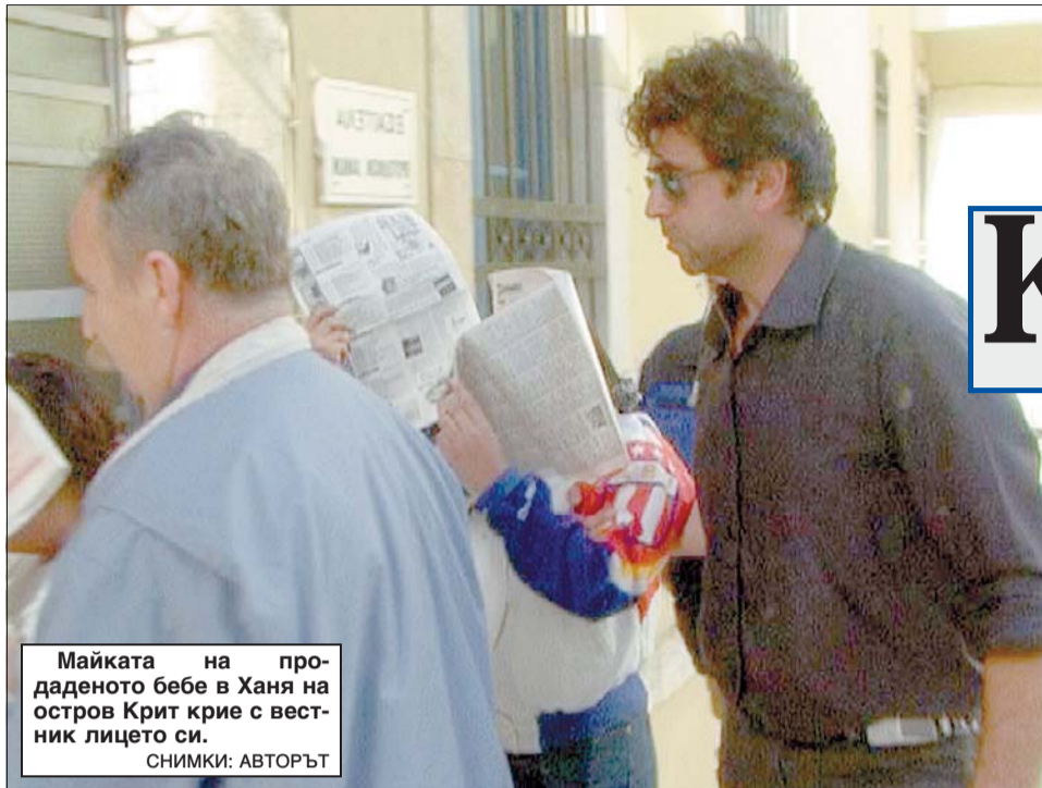
Майката на продаденото бебе в Ханя на остров Крит крие с вестник лицето си.