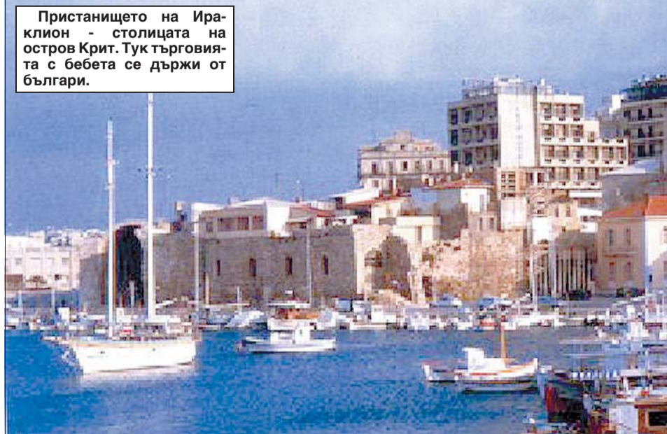
Пристанището на Ираклион - столицата на остров Крит. Тук търговията с бебета се държи от българци.

В различните държави българчетата се търкуват различно. Средната цена във Франция например е 5-6 хил. евро, в Гърция при последния арест в Пирея тя е стигнала 20 000 евро. Вероятно цената се е качила поради нарасналия риск при сделките.